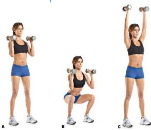
SQUAT JETE avec bouteilles d'eau