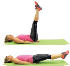
CRUNCH INVERSE Jambes tendues