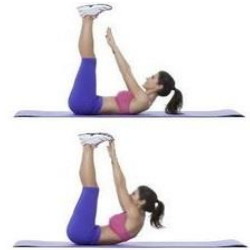
CRUNCH Jambes tendues